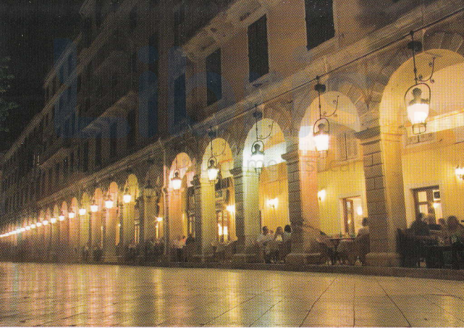
Famosul bulevard Listón din orașul Kérkyra (Corfu)

Corfu este și poarta spre vest a Greciei, autointitulându-se cu mândrie „intrarea în Marea Adriatică”. Este de remarcant faptul că turcii – care au cucerit restul Greciei continentale, iar dintre Insulele Ionice, Lefkáda – nu au reușit să cucerească și Corfu. În schimb, marile puteri ale Europei de Vest (Veneția, Franța și Marea Britanie) și-au lăsat amprenta pe parcursul a cinci secole de ocupație a insulei. Nicăieri nu este mai vizibil acest fapt decât în arhitectura elegantă și atmosfera cosmopolită din orașul Kérkyra. În ce alt loc din lume ați putea sta într-o cafenea în stil francez, pe străduțe venețiene, savurând cafea grecească în timp ce admirați un palat englezesc? Această capitală elegantă este considerată a fi cel mai frumos oraș din toate insulele grecești.